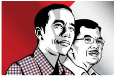
TRISAKTI & NAWA CITA